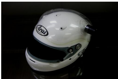
Arai 社製ヘルメット装着例

熱を帯びた人体を冷やす上で最も効果的な頭部に効率よくエアコンの冷却風を当てるためのクーリングパーツです。