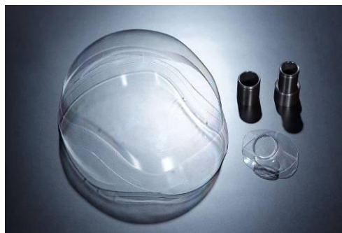
GT クーリングヘルメットカバー + ホース側アダプター